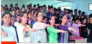
राज्य... सरस्वतीनगर कॉलेज में रैगिंग से दूर रहने की शपथ लेते हुए विद्यार्थी।

उन्होंने कहा कि रैगिंग एक दंडनीय अपराध है और इसे किसी भी परिस्थिति में सहन नहीं किया जाएगा। उन्होंने छात्रों को आसानी से सीढ़र, सम्मान एवं अनुशासन